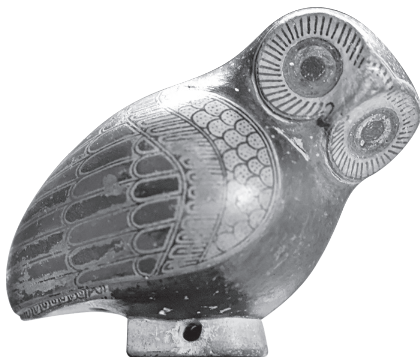
Aryballe protocorinthien en forme de chouette C., Musée du Louvre / CC0 Public Domain, Jastrow