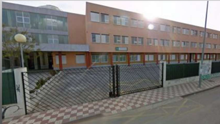
IES Aricel, Albolote, Grenade

Pour participer à l'échange avec un établissement espagnol, à Grenade et vivre pendant 8 jours en réelle immersion culturelle